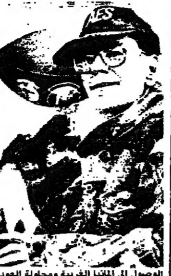
الوصول الى الغنما الغربية ومحاوله العودة الى امرتة شخصية بولهييل